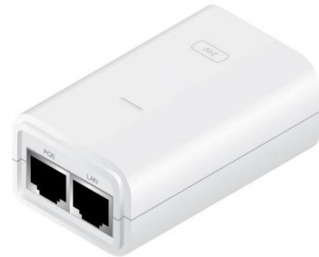
Изображение блока питания может немного отличаться (цветом, размером и т.д.)

Рекомендация: Для обеспечения дополнительной безопасности БП и основного устройства, рекомендуем подключать электропитание через ИБП (Источник Бесперебойного Питания).